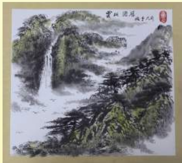
孔宪玉《云山固居》绘画类第三名